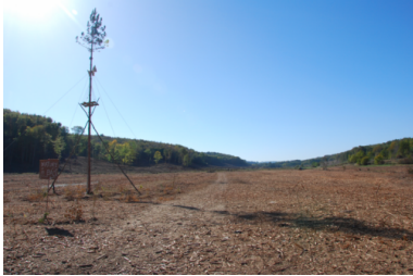
La zone déboisée de Sivens

dimanche 26 octobre, l'État sait déjà tout ou presque du drame, mais va choisir de feindre l'ignorance et de minimiser pendant 48 heures.